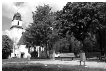
Auftakt zum 1. Ökumenischen Neujahrstreff in der Klarenthaler Pfarrkirche

Mit einem ökumenischen Gottesdienst unter dem Thema „Jesus Christus, das Licht der Welt“ in der katholischen Pfarrkirche St. Bartholomäus Klarenthal fand am Samstag, 15. Januar 2011, der 1. Ökumenische Neujahrsempfang von